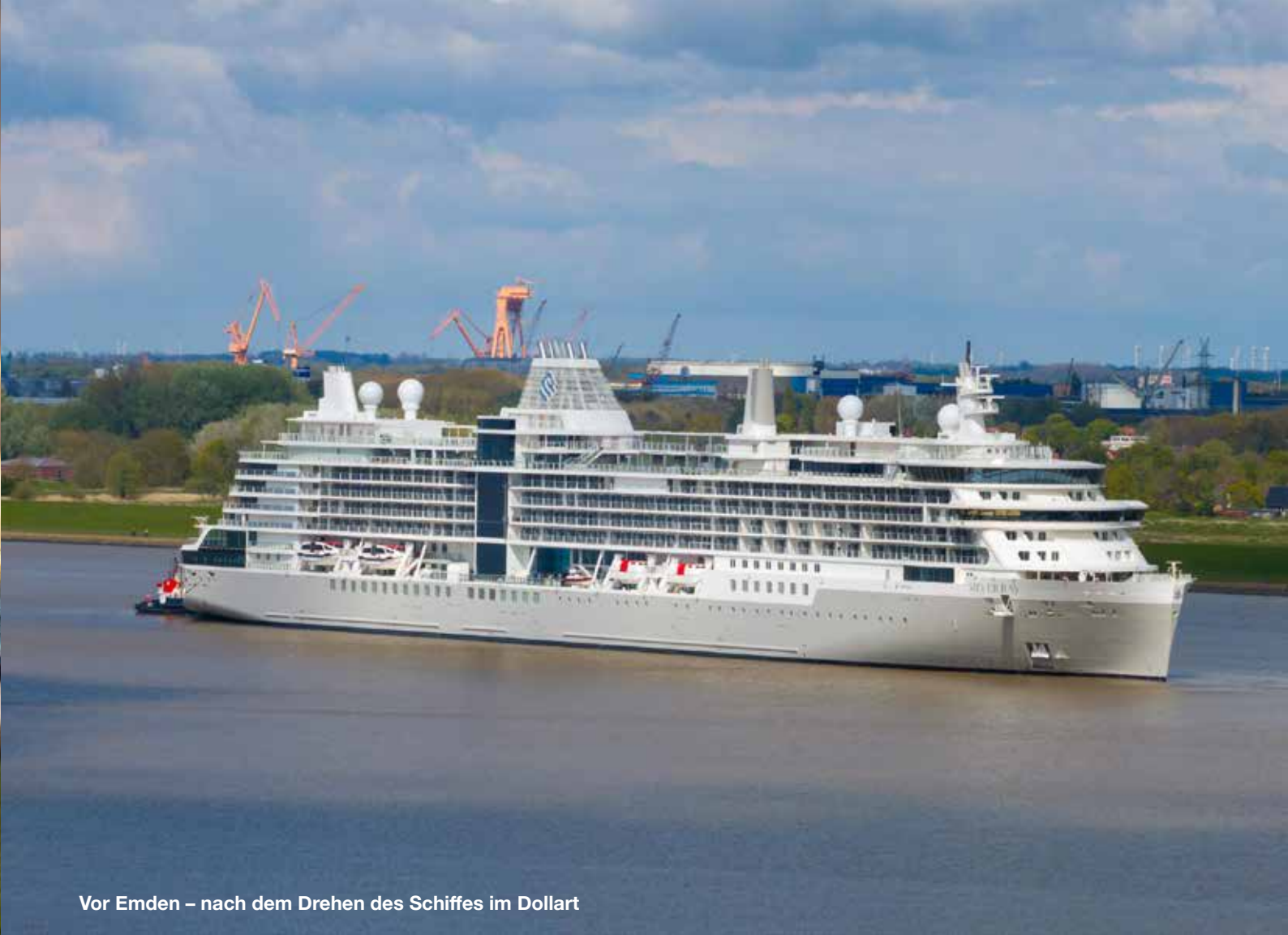
Vor Emden – nach dem Drehen des Schiffes im Dollart