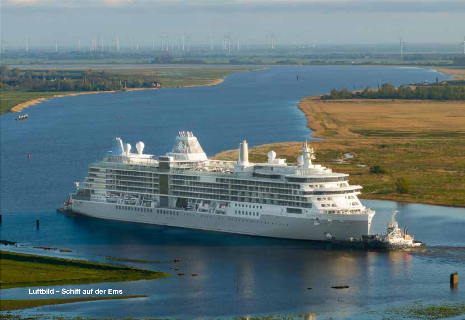
Luftbild – Schiff auf der Ems