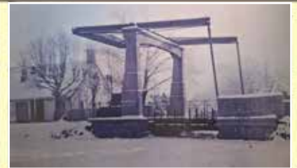
Beton-Hubbrücke aus den 40er Jahren (Brandenburger Tor) war Übergang zur Wiek und den Gasthauskanal