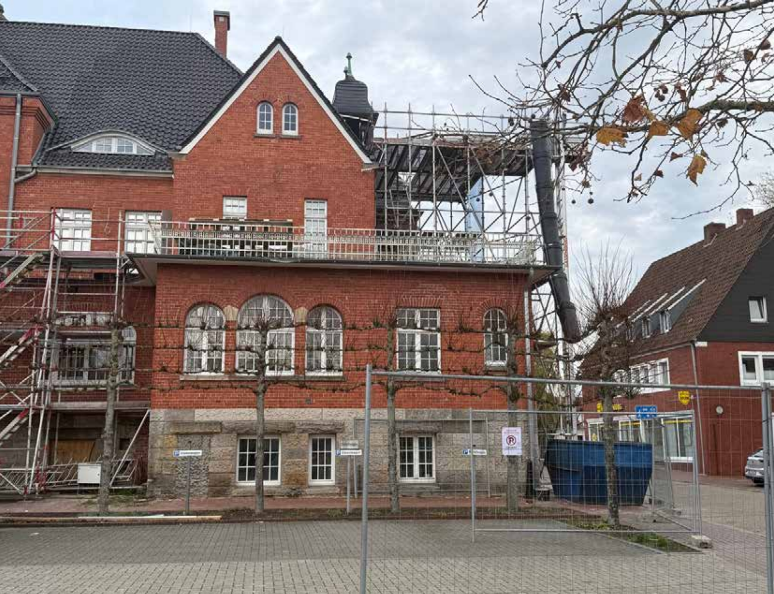
Das historische Rathaus der Stadt Papenburg wurde 1913 gebaut.