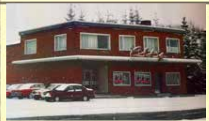
Hier sehen wir das City Kino am Grader Weg, gegenüber von Ford Ahrens